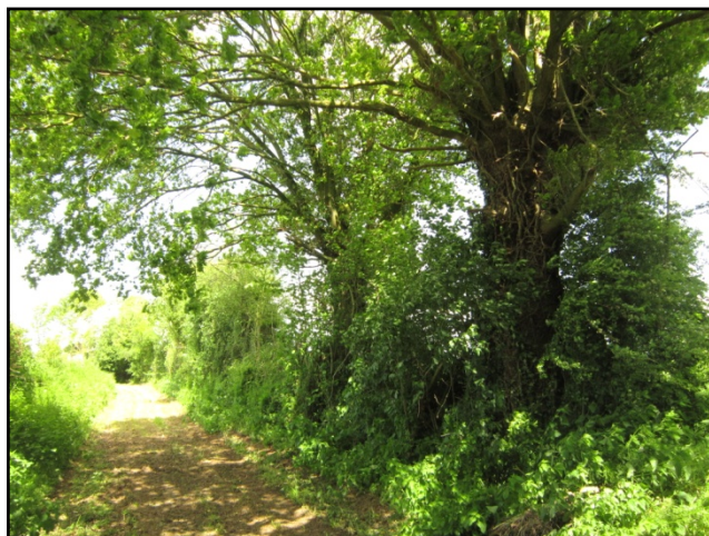
Photo ci-contre : Haie bocagère protégée au titre la loi paysage présentant un potentiel pour les coléoptères xylophages et sapro-xylophages (vieux chênes têtards). Proche du village de Patagousse