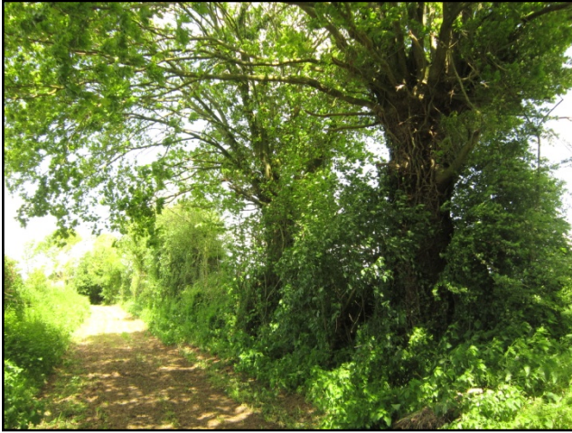
Photo ci-contre : Haie bocagère protégée au titre la loi paysage présentant un potentiel pour les coléoptères xylophages et sapro-xylophages (vieux chênes têtards). Proche du village de Patagousse

Photo ci-contre : Zone 1 AU aujourd'hui occupée par des activités agricoles. Absence de bocage