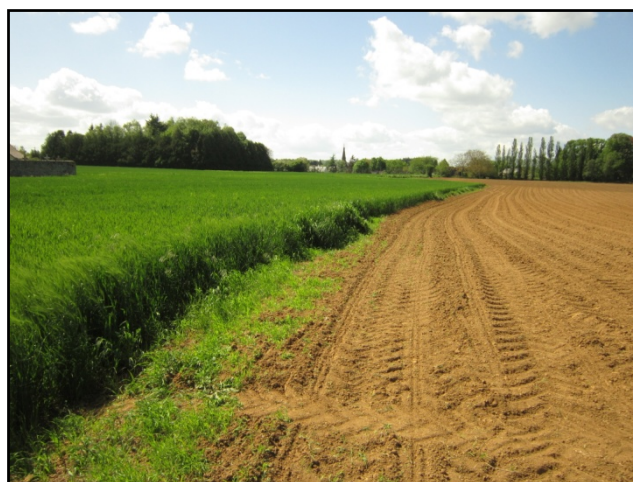
Photo ci-contre : Zone 1 AU aujourd'hui occupée par des activités agricoles. Absence de bocage