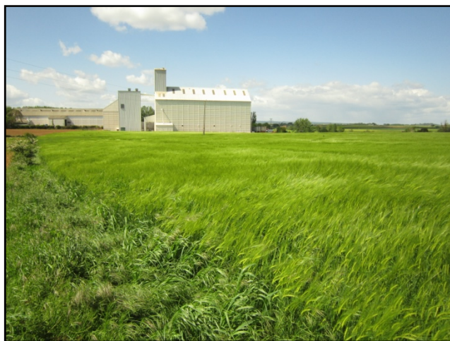
Photo ci-contre : Zone 1AUZ aujourd'hui occupée par des activités agricoles. On note également l'absence de bocage