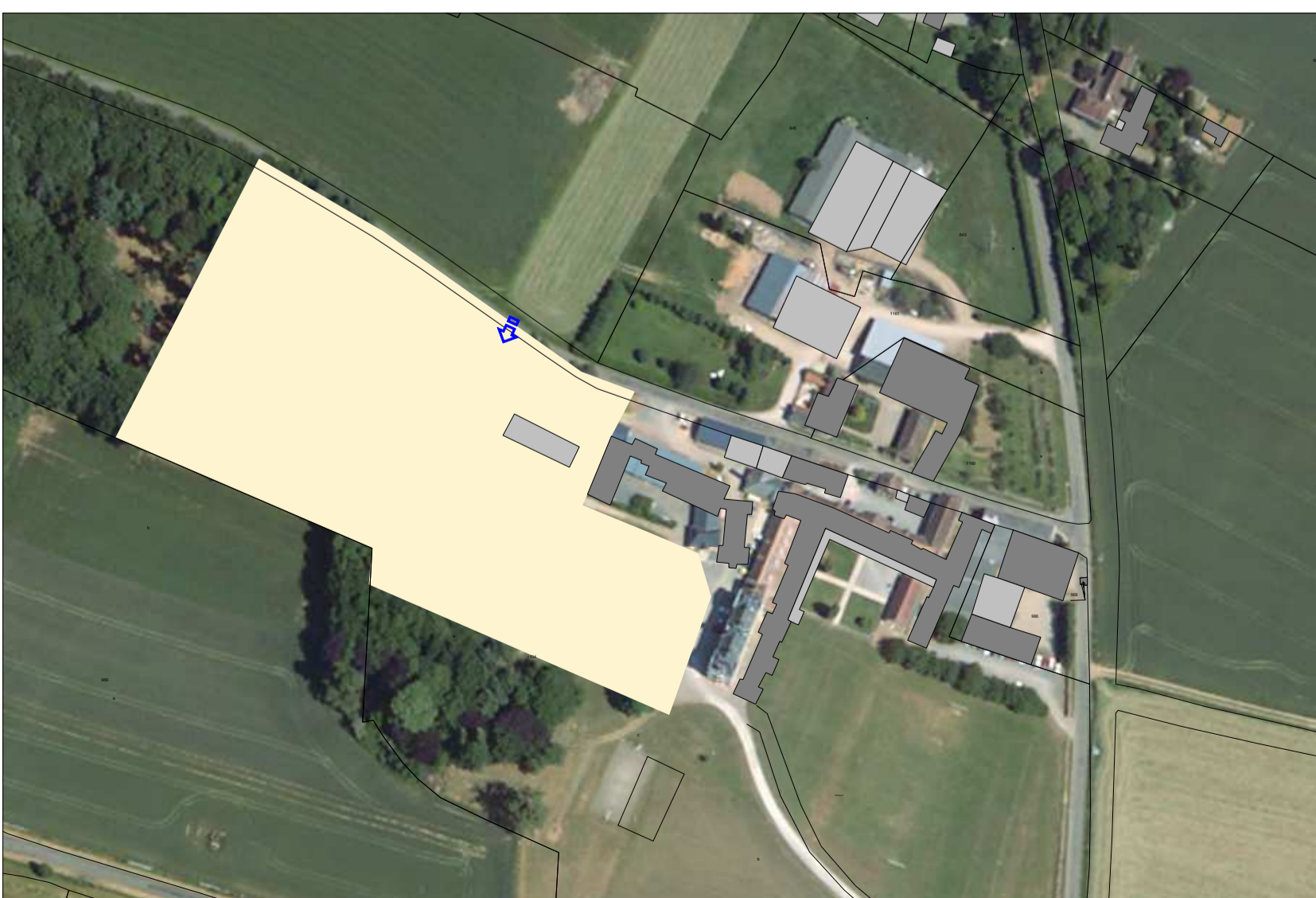
Site arrière de l'IREO

Principes de composition urbaine et de programmation : réaliser une mixité d'habitat en combinant les formes urbaines sur l'ensemble de l'opération.